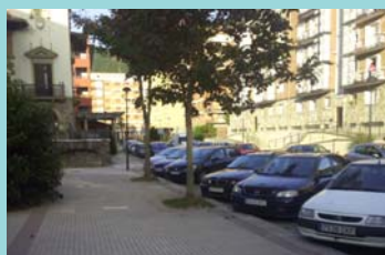
Mauleon hotelaren parean presako enkarguetarako egokituko diren aparkalekuak.