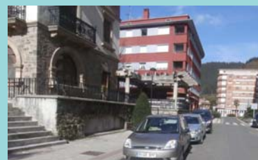
Etxeko eta dendetako hondakinak biltzeko kokaleku berria Plazaola kalean (Bolatokiaren parean).