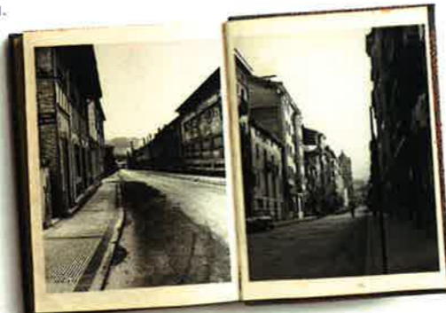
GI-2630. LEGAZPIKO SARRERA

Legazpiko hirigintzaren bilakaera eta berrantolaketa. Antolakuntza-konzeptu bat, zeinak sortzen baitu industria-paisaia paregabe bat, gaur egun oraindik ere harrigarria dena.