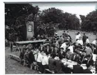
LANGILEEN BAZKARIA, URBASAN. 1939

1936: Espainiako Gerra Zibila. Legazpi konfiskatua eta militarizatua izan zen, gerrarako.