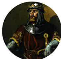
ANTSO IV.A GAZTELAKOAK

"...tengo por bien que las ferrerías que son en Legazpia masuqueras, que están en yermo, e las hacen robos los malos homes e los robadores, que vengan más cerca de la villa de Segura..."