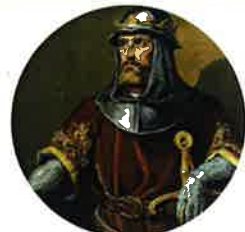
SANCHO IV DE CASTILLA

"...tengo por bien que las ferrerías que son en Legazpia masuqueras, que están en yermo, e las hacen robos los malos homes e los robadores, que vengan más cerca de la villa de Segura..."