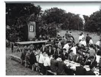
COMIDA DE LOS OBREROS EN URBASA 1939

1936: Guerra Civil Española. Legazpi es confiscada y militarizada para la guerra.