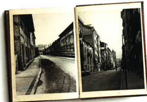
GI-2630. ENTRADA A LEGAZPI

Evolución y reordenación urbanística de Legazpi. Un concepto de organización que genera un paisaje industrial único, que aún hoy día sorprende.