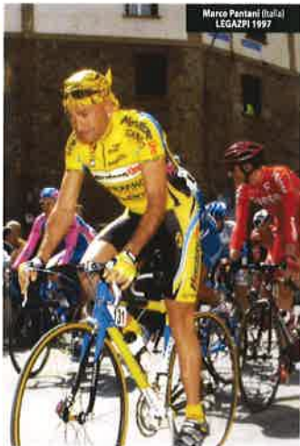
Marco Pantani (Italia) LEGAZPI 1997