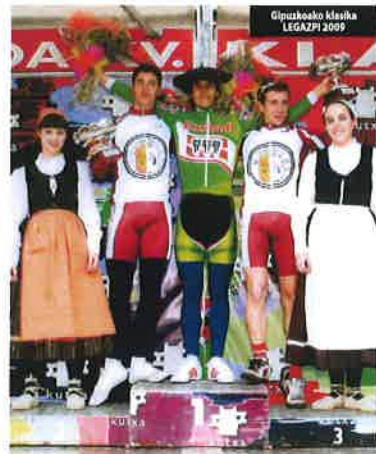
Gipuzkoako klasika LEGAZPI 2009