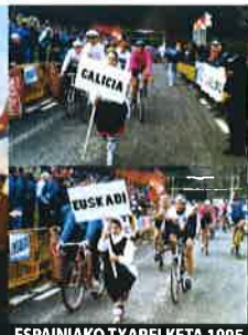
ESPAINIAKO TXAPELKETA 1995