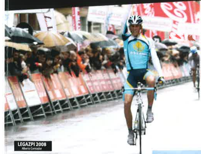
LEGAZPI 2008 Alberto Contador

Erakusketan, 250 argazki ikusi ahal izango dira, koadrotan banatuta. Azken 40 urteetan Elkarteak herrian egin dituen lasterketa eta gertakari nagusiak biltzen ditu. Inaugurazio ekitaldia Otsailaren 25ean egingo da eguerdiko 12:00etan Kultur Etxean, eta hainbat txirrindulari eta txirrindulari ohi bertan izatea espero da, baita txirrindularitzari loturiko zenbat aurpegi ezagun ere.