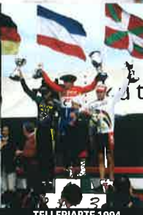
TELLERIARTE 1994 P.Brejns R. Goenendal P.Camda