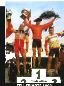
TELLERIARTE 1993 P.Herreros R. Goenendal D. De Be

Ordutegia / Horario: Astelehenetik ostiralera 17:30 - 20:30 De lunes a viernes