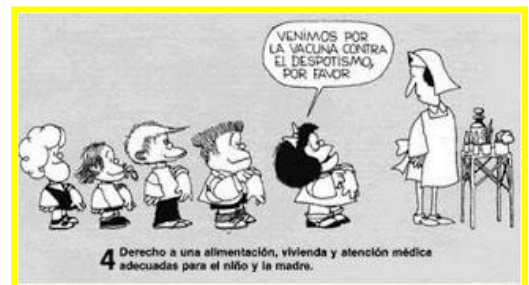
4 Derecho a una alimentación, vivienda y atención médica adecuadas para el niño y la madre.

hartu. Estatuak, ama edo/eta aitei erraztasunak jarri eta baliabideak eskaini behar dizkie, guraso bezala, beraien erantzukizunei aurre egin ahal izateko. Horrez gain, gurasoek beraien funtzioak bete ezin dituztenean, Estatuak haur, ume edo nerabeen beharrezkoak eta eskubideak bermatu behar ditu.