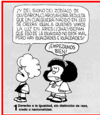
1 Derecho a la igualdad, sin distinción de raza, credo o nacionalidad.

2014. urtean, Haurren Eskubideei Buruzko Hitzarmenaren 25. urteurrena ospatu da. Bertan 54 artikulua jasotzen dira (1989ko azaroaren 20ean Nazio Batuen Batzar Nagusiak onartu zituen). Eskubideen artean ondorengo oinarritzko lau printzipio hauek biltzen dira: