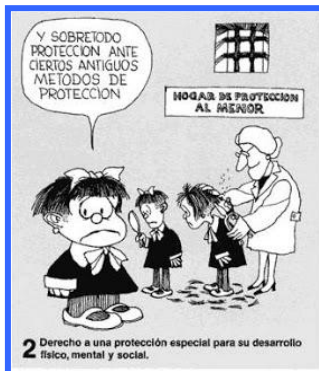
2 Derecho a una protección especial para su desarrollo físico, mental y social.

Estatuak eta jendartea osatzen dugunok, (familia, entitateak, hezkuntza komunitateak, erakundeak, komunikabideak...) eskubide hauek babesteko eta bermatzeko erantzukizun partekatua dugu.