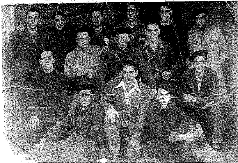
Grupo de gudaris. Perteneciente a la época en la que los republicanos estaban al mando de Legazpi