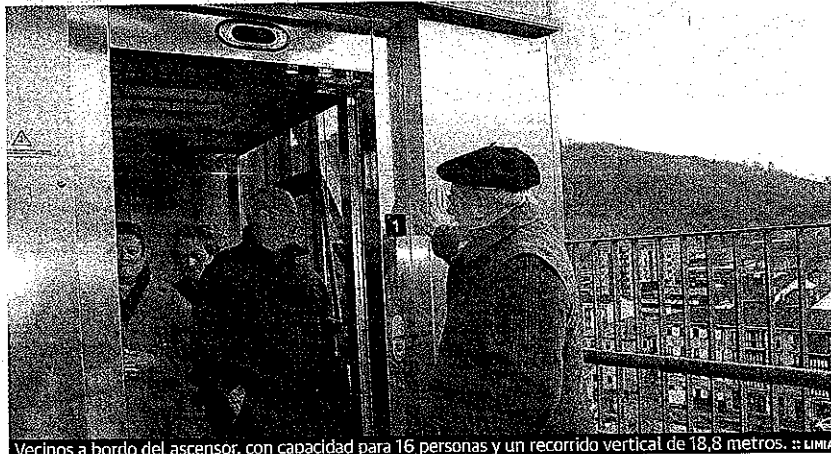
Vecinos a bordo del ascensor, con capacidad para 16 personas y un recorrido vertical de 18,8 metros. ■ LIMIA

El primer ascensor público de Legazpi comenzó a circular ayer en el tramo que une Latxartegi con Juanastegi. A lo largo de la mañana fueron montando los primeros pasajeros, entre los que el comentario general era satisfactorio: «Es cómodo, pero sobre todo práctico, ya que los vecinos de los barrios de arriba nos ahorramos una importante subida, ahora hace falta que todos lo cuidemos», indicaba un grupo de viajeros. El ascensor funcionará de 7 a 22 horas.