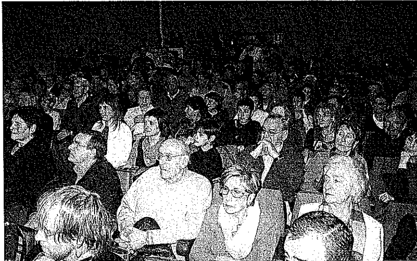
Aforo. Los vecinos abarrotaron el salón de kultur etxea en la presentación.

A todas esas víctimas está dedicada la segunda parte del libro, donde se han recogido sus vidas, retratos y las circunstancias en las que murieron. La primera parte de la