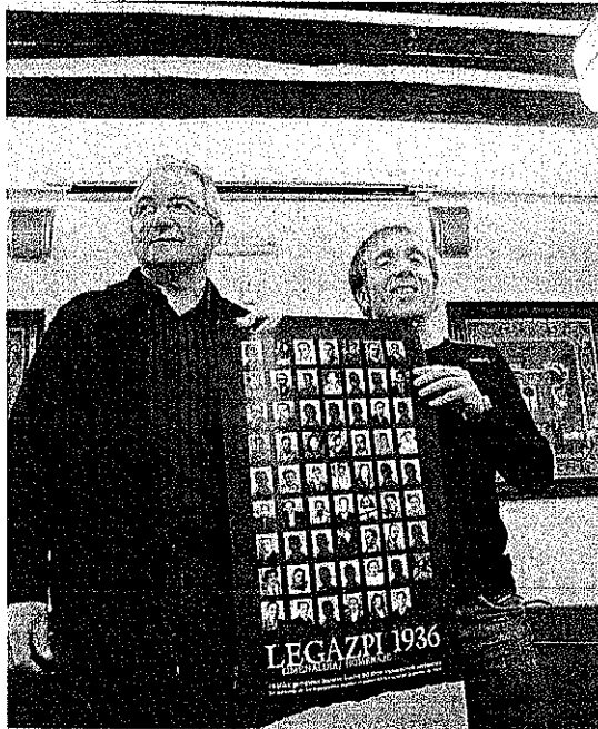
Plazaola y Alzela. Con el cartel de los actos programados :: LIMIA

En referencia a los fallecidos, detallaron que «9 de ellos murieron fusilados, 29 en el frente, 3 desaparecidos, 11 por consecuencias de la guerra y 7 al ser llevados obligatoriamente a luchar con los fascistas».