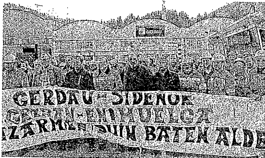
Trabajadores de Sidenor, concentrados ayer, en Azkoitia. SUZUPE

La plantilla de la que forma parte un centenar de legazpiarras exige «la oportunidad de negociar por su convenio laboral»