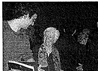
Cálida acogida. El autor con una de las asistentes.

publicación, por su parte, se centra en la narración de los hechos que tuvieron lugar en Legazpi durante aquellos años de guerra.