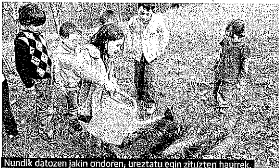
Nundik datozen jakin ondoren, ureztatu egin zituzten haurrek.

¿GALILEA. Atzo Nundik datoz perretxikoak? tailerra aurrer eraman zen Igartubeiti Museoan, honetan hamar umek parte hartu zutelarik. Perretxikoak lurrana edo zuhaitzetan hazten direla jakin, haziak jarritako tokiak ureztatu gustora ibili ziren txikiak!